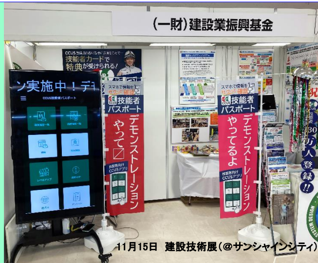
11月15日 建設技術展(@サンシャインシティ)

全国で活躍するCCUS認定アドバイザーの意見交換会が11月24日に当財団において開催されました(参加者数75名)。