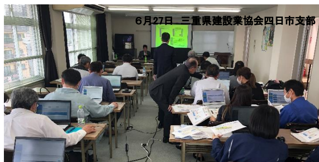
6月27日 三重県建設業協会四日市支部

認定アドバイザーである行政書士による意見交換会が7月11日に当財団において開催されました(参加者数47名)。