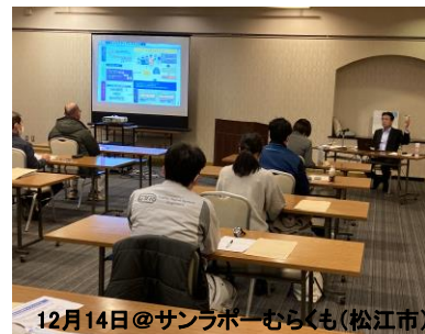
12月14日@サンラポーむらぐも(松江市)