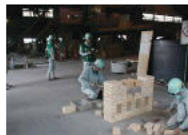
写真2 技能競技大会 Skill competition