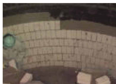
写真1 築炉作業 Situation of brick work